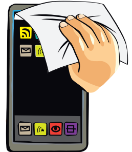
Schritt 2 - 3

Wischen Sie sanft über die Oberfläche Ihres Mobiltelefons oder Mobilgeräts.